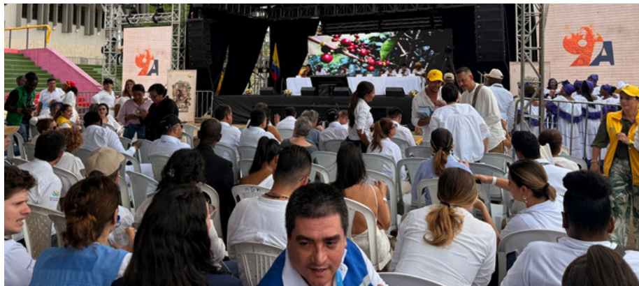
Reunión con Dirección Territorial en Chocó.