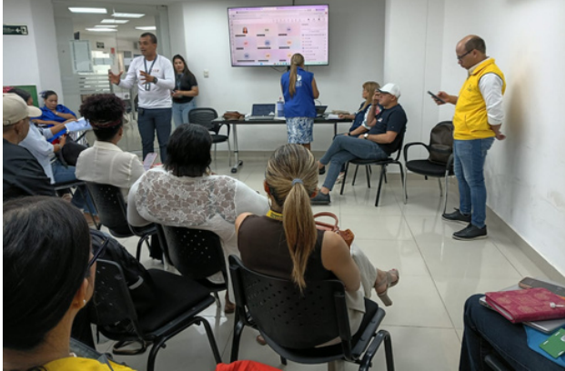
Reunión con Mesa de víctimas en Magdalena.