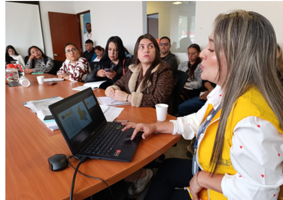
Encuentro de capacitación despliegue territorial - Nariño.