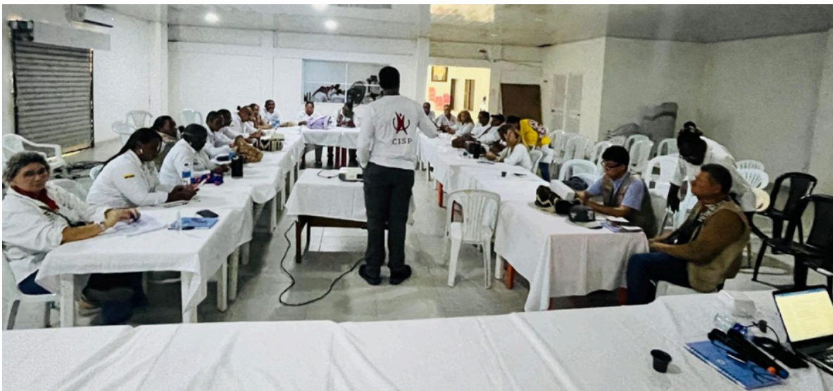
Reunión San Martín de Loba, Bolívar.

En esencia, el Convenio 2821 de 2026 marca un avance significativo en la implementación de estrategias territoriales que priorizan la cercanía con las víctimas, el reconocimiento de sus contextos y la garantía efectiva de sus derechos. A través de este esfuerzo conjunto, se busca contribuir a la reconstrucción de proyectos de vida y al fortalecimiento de una atención más humana, accesible y pertinente en todo el territorio nacional.